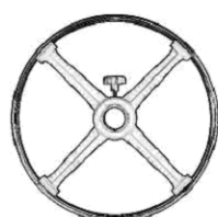
kruhová podnož GA 05-S1